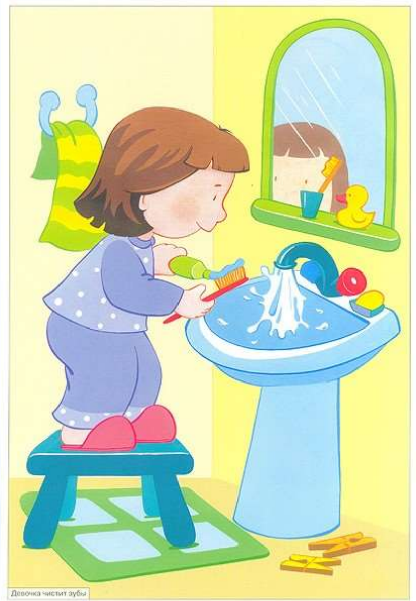
Девочка чистит зубы

Соблюдайте сами режим дня и требуйте этого от своих детей